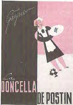
LA DONCELLA DE POSTIN

Artistas aún en activo, como Antoni Tàpies o el mallorquín Miquel Barceló; algunos de los más grandes representantes de las vanguardias de principios de siglo, como Pablo Picasso, María Blanchard o Francisco Borés; y nombres de referencia obligada en la historia reciente del arte catalán, como Josep Guinovart o Antoni Clavé (en la foto, La doncella de postin , 1941). Todos ellos están representados en la muestra Modernitat , con la que la galería Manel Mayoral ha inaugurado el curso 2003-2004. Allí encontrarás también obras de Antonio Gaura, Óscar Domínguez, Wilfredo Lam y Manuel Millares.