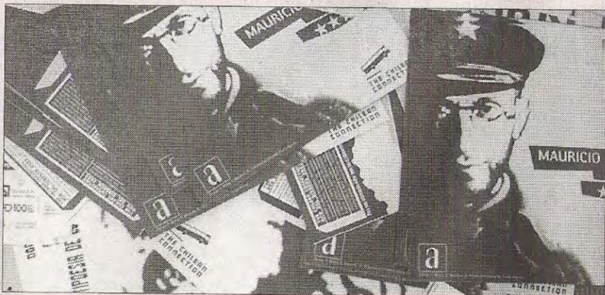
►► Una imagen de las micros santiaguinas .