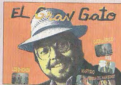
►► Carátula de El gran Gato .

El director Ventura Pons y artistas como Sisa, Lucrecia y Moncho, entre otros, acuden hoy a la FNAC L'illa para presentar el DVD de su documental sobre Gato Pérez, 'El gran Gato'. Diagonal, 549. A las 19.00 horas.